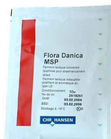
Torebka 10U 50 ÷ 100 L