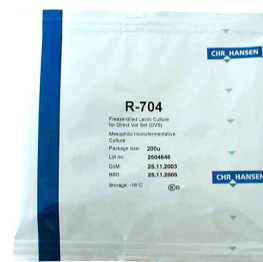
Torebka 200U 1000 ÷ 2000 L